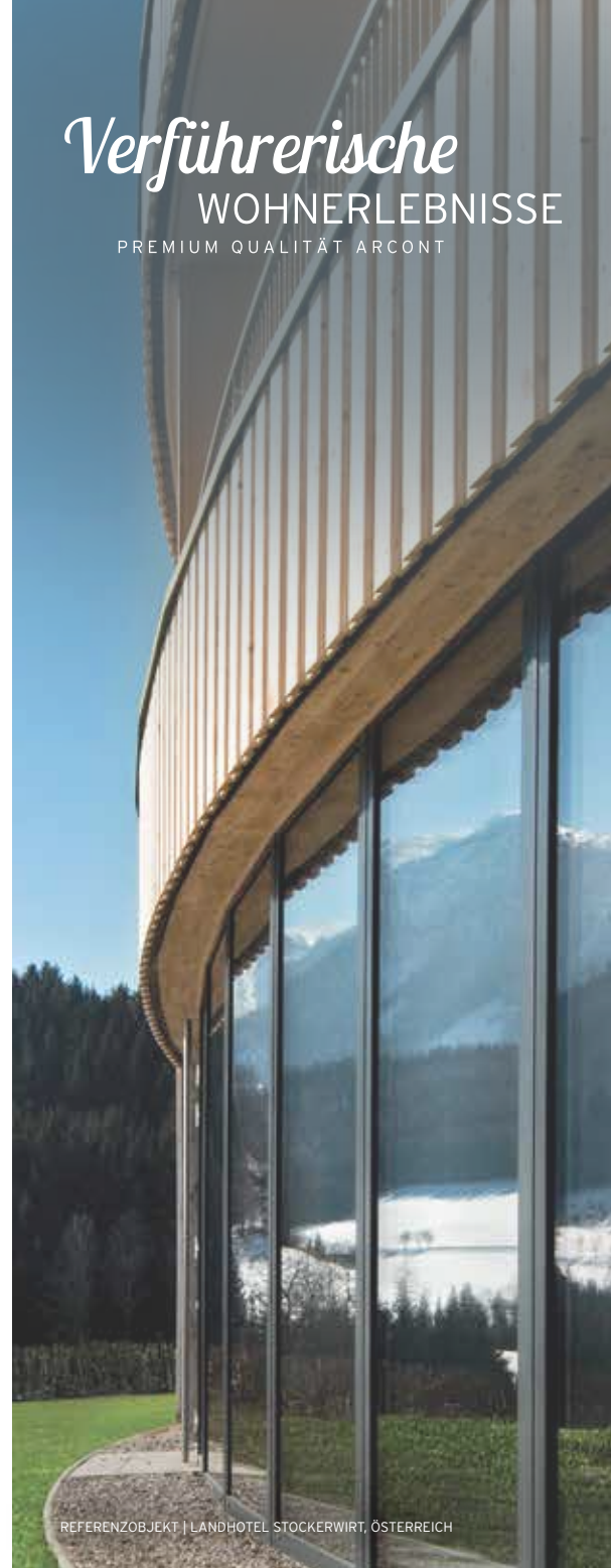
REFERENZOBJEKT | LANDHOTEL STOCKERWIRT, ÖSTERREICH

Verführerische WOHNERLEBNISSE PREMIUM QUALITÄT ARCONT