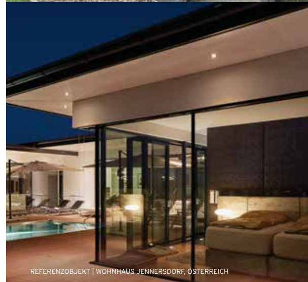
REFERENZOBJEKT | WOHNHAUS JENNERSDORF, ÖSTERREICH